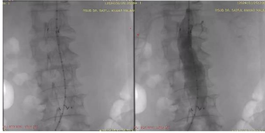
Gambar 3. Prosedur EVAR. Implantasi Stent Graft Torakal 26x130mm Dan Evaluasinya.